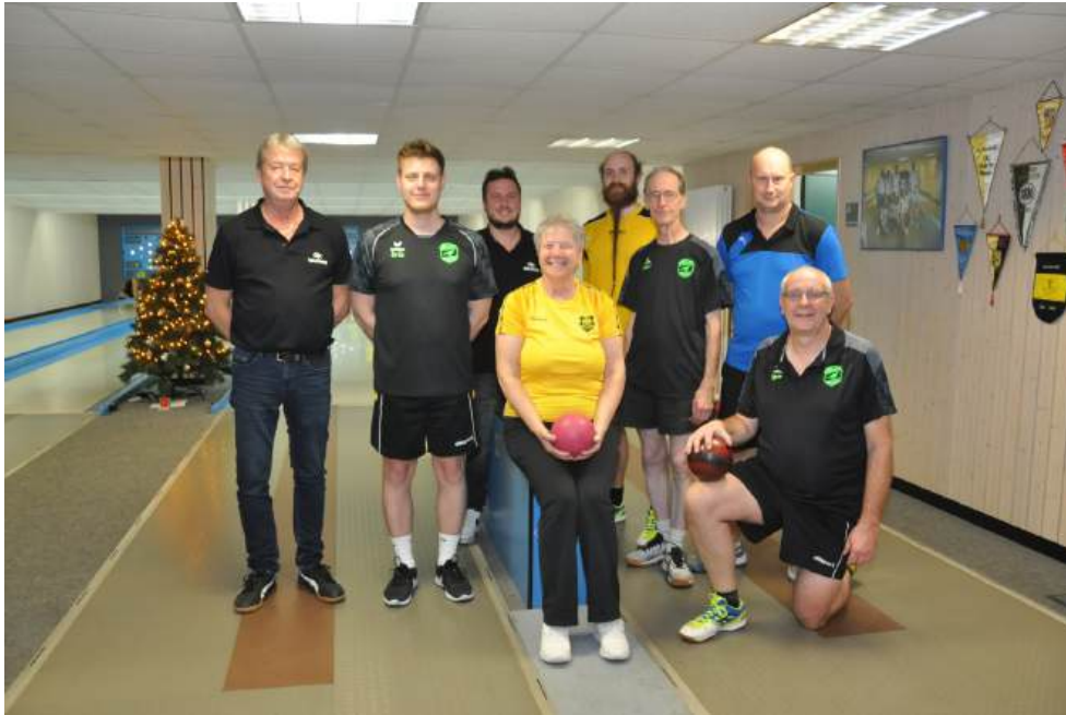
Foto der Teilnehmer

Das Turnier ist der Beginn, eine eingeschlafene Tradition neu aufleben zu lassen.