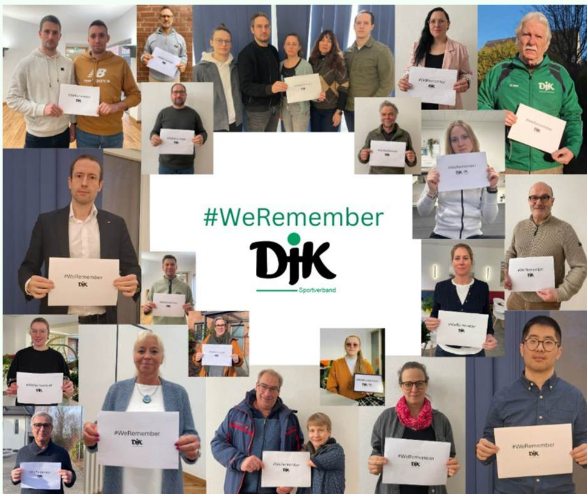
Bild: Die hauptberuflichen Mitarbeiter des DJK-Sportverbandes positionieren sich (auf dem DJK-Hauptberuflichen Seminar in Bonn) zu #WeRemember.

Der Internationale Tag des Gedenkens an die Opfer des Holocaust (International Holocaust Remembrance Day) am 27. Januar wurde im Jahr 2005 von den Vereinten Nationen eingeführt. #WeRemember ist eine weltweite Kampagne des World Jewish Congress (WJC) und der UNESCO.